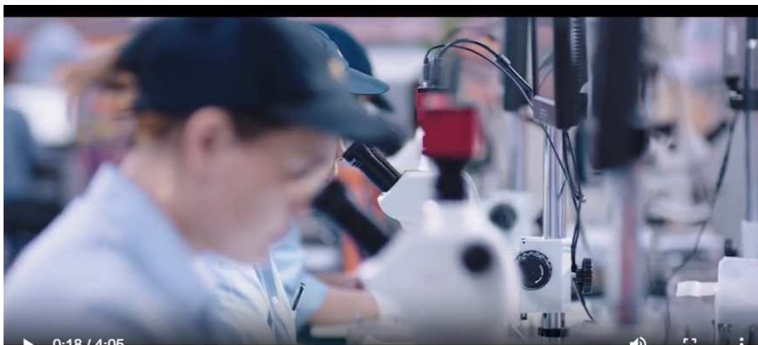
9-CONTROL DE MEDICIÓN 26 PUNTOS DE CONTROL BAJO CONTRAO