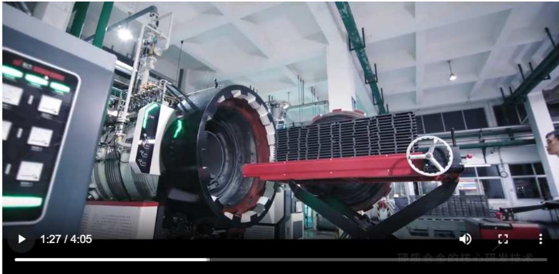
4-DIFERENTES TRATAMIENTOS TÉRMICOS