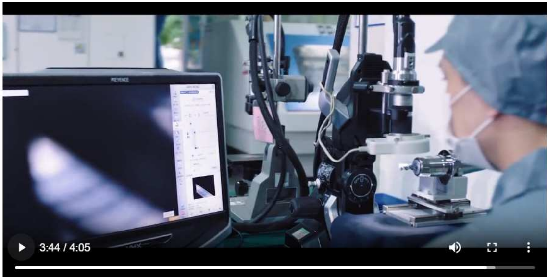
6-CONTROL QUIMICO, ESTRUCTURA GRANLAR Y ENSÁYOS DE PORPORCIONES MECÁNICAS