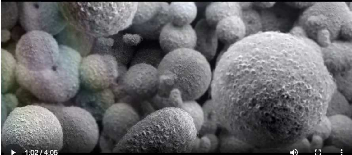
6-CONTROL QUIMICO, ESTRUCTURA GRANLAR Y ENSÁYOS DE PORPORCIONES MECÁNICAS