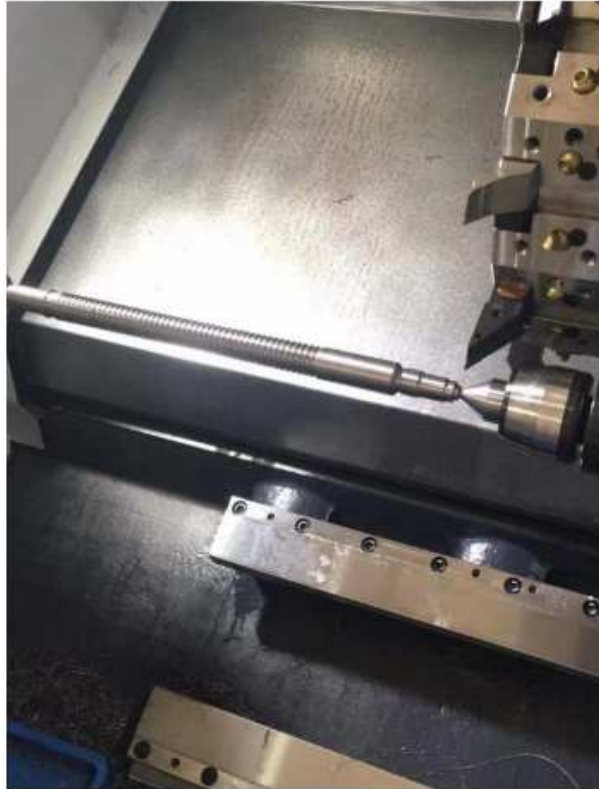
8-EVOLUCIÓN DE MECANIZADO