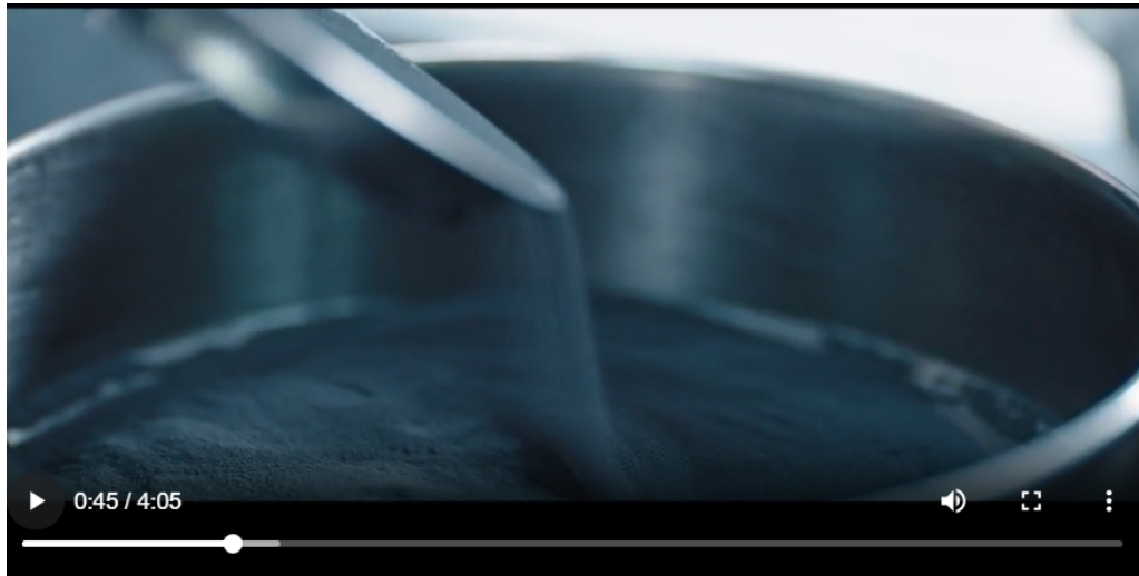
1- FABRICACIÓN DE BARRA EN BRUTO ( SIN MECANIZAR) PASO 1- OBTENCIO DE POLVO METALÚRGICO ( VIENE DE MINERALES)