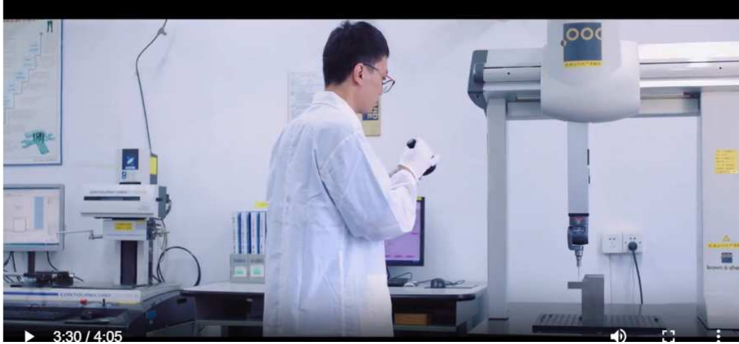
9-CONTROL DE MEDICIÓN 26 PUNTOS DE CONTROL BAJO CONTRAO