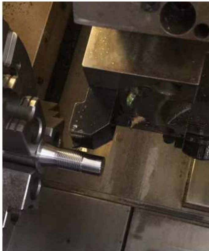
8-EVOLUCIÓN DE MECANIZADO