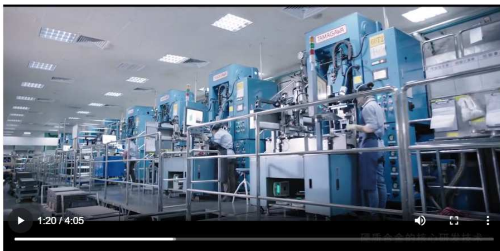
3- SE PRENSA EL PRODUCTO PARA OBTENER UNA PRE BARRA EN BRUTO