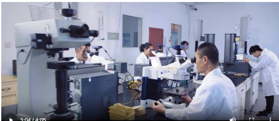
6-CONTROL QUIMICO, ESTRUCTURA GRANLAR Y ENSÁYOS DE PORPORCIONES MECÁNICAS