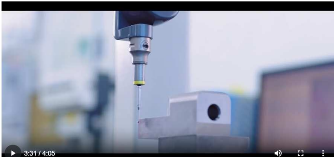
9-CONTROL DE MEDICIÓN 26 PUNTOS DE CONTROL BAJO CONTRAO